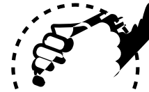
• Modernes Arbeitsumfeld