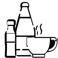
• Kostenlose Getränke