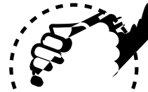
• Modernes Arbeitsumfeld