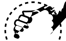
• Modernes Arbeitsumfeld